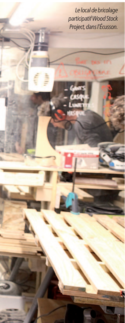
Le local de bricolage participatif Wood Stock Project, dans l'Écusson.